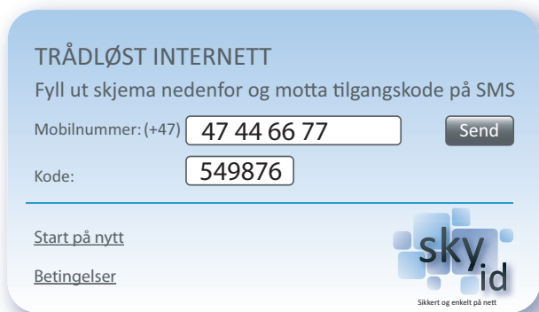
Eksempel på innloggingsportal

Sky ID utfører forsvarlig logging av datatrafikk i nettverket og lagrer denne i henhold til aktuelle forskrifter. Denne informasjonen vil etter utløpt periode bli slettet.